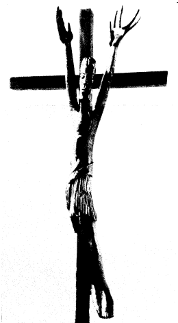
Der auferstandene Jesus Christus. Josef Ellner, Traunstein

Diese faszinierende Wirklichkeit hatte für mich enorme Konsequenzen. Ich begriff: Seit der Auferstehung Jesu gibt es keine ausweglose Situation mehr. Wem immer ich begegne, Christus ist immer schon vor mir da. Ob am Krankenbett, im Spital oder in Emmaus – in jedem Menschen fragt mich der Auferstandene: Liebst du mich?